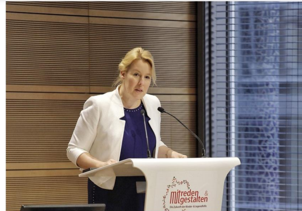
Bundesjugendministerin Dr. Franziska Giffey startet den Beteiligungs- und Dialogprozess zur Modernisierung der Kinder- und Jugendhilfe